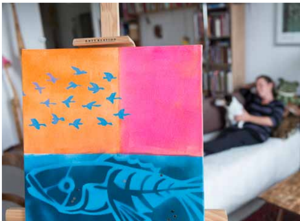
Structuur is belangrijk: „Met mijn coach neem ik door hoe het gaat met eten, slapen, uitrusten. Met haar heb ik de puntjes op de i gezet.”