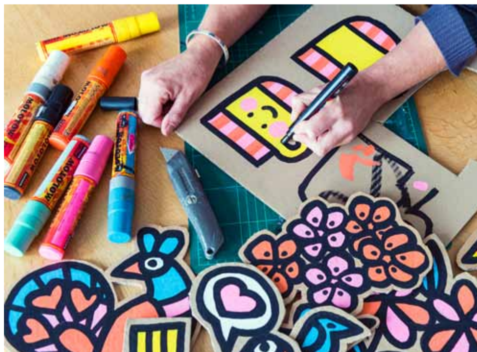
De kleuren spatten van haar kunstwerken af. „Ik vind het leuk om vrolijke kaarten te maken en te sturen en daarmee mensen blij te maken.”